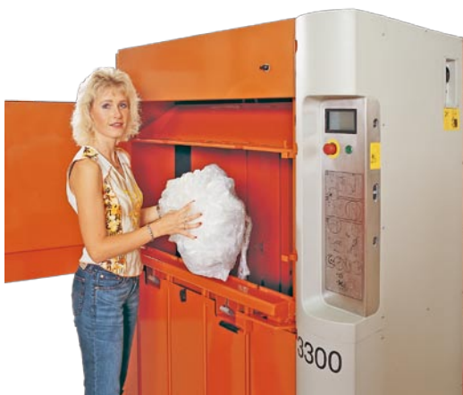
Пресс позволяет без труда загрузить и спрессовать материалы различного типа, например, бумагу или пластик.

Orwak 3300 – результат 30 летнего опыта производства прессов. Безопасный для оператора. Быстрый и мощный, созданный для эффективной работы. Простой в управлении.